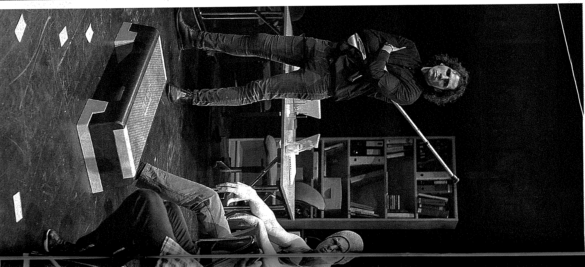
ÆRLIG: Aggressiv, men ærlig innsett.