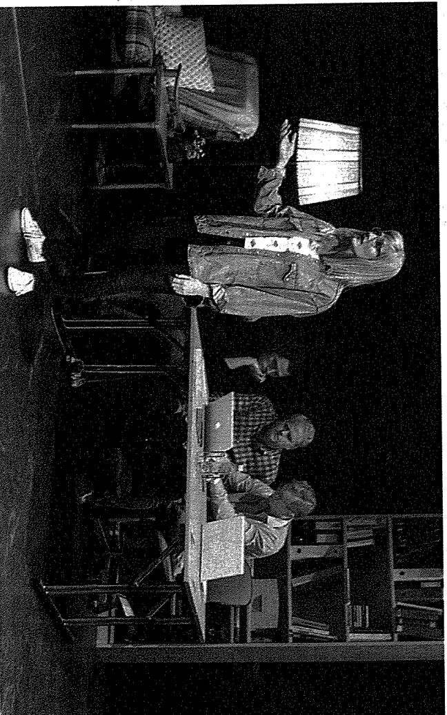
STEMME: Aktivistens stemme og forskerens blikk.

ne upremieren må videre, ut på veien inn i skolesekker og opp på arbeidsplasser.